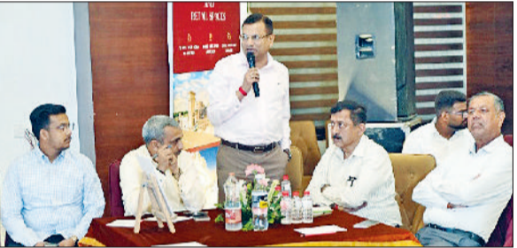
सिरसा। सिटी सेंटर में आयोजित चैनल पार्टनर मिट में सिटी सेंटर बारे जानकारी सांझा करते हुए।

रेजीडेंशियल काम्प्लेक्स का निर्माण किया जा रहा है। उन्होंने बताया कि इसका युद्ध स्तर पर निर्माण कार्य जारी है। करीब सवा सात एकड़ एरिया में इसका निर्माण कार्य जारी है, जिसमें करीब 600 गाडियों की पार्किंग की सुविधा है। पूरा एरिया सीसीटीवी कैमरे की