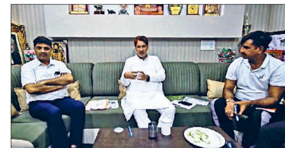
फतेहाबाद। जानकारी देते हुए सांसद सुभाष बराला।

राज्यसभा सांसद सुभाष बराला ने कहा कि प्रधानमंत्री नरेंद्र मोदी के नेतृत्व में खेल क्षेत्र में देश की प्रतिभाओं को आगे लाने के लिए केंद्र सरकार ने ठोस कदम उठाए हैं। इसी कड़ी में सांसद खेल महोत्सव की शुरुआत की गई है, जिसका मुख्य उद्देश्य ग्रामीण स्तर की प्रतिभाओं को मंच प्रदान कर उन्हें राष्ट्रीय और अंतरराष्ट्रीय स्तर तक पहुंचाना है। सांसद बराला ने