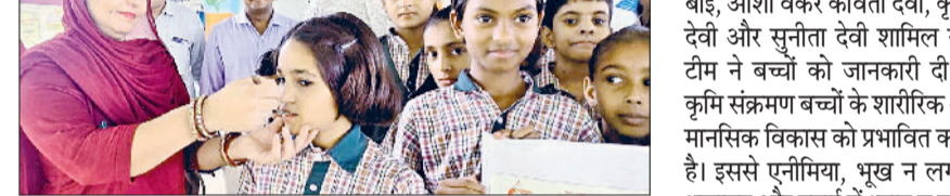
भूना। छात्रा को एल्बेंडाजोल की गोली खिलाते स्वास्थ्य विभाग की टीम।

राष्ट्रीय कृमि मुक्ति दिवस पर विशेष कार्यक्रम आयोजित