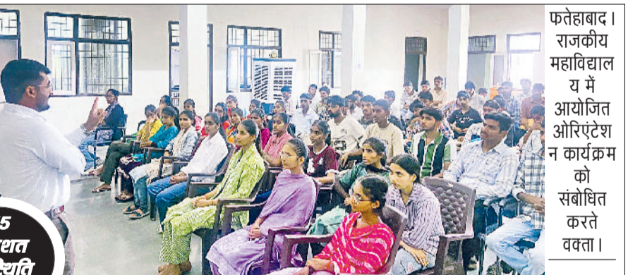
75 प्रतिशत उपस्थिति अनिवार्य

विद्यार्थियों के स्वागत से हुई, जिसके उपरंत कॉलेज की महत्वपूर्ण नीतियों और नियमों पर विस्तारपूर्वक चर्चा की गई। छात्रों को बताया गया कि कॉलेज में नियमित उपस्थिति